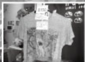
理事長のイラストTシャツ イラストレーターでもあります