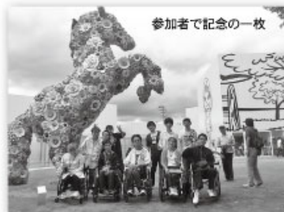
参加者で記念の一枚

就労継続支援B型事業所スタジオとまと (協力 自立生活センターPingあおもり)