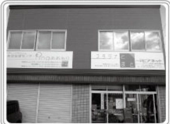
国道7号線沿いで騒音がすごいで、左側は常にシャッターを開けたままにしています。