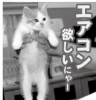
※写真と本文は関係ありません

最近はやや夜、窓を開けなくても過ごせるようになり、「騒音」に悩まされることは無くなりましたが、まだ気温が高めなので体調管理には気をつけたいと思います。(西滝)