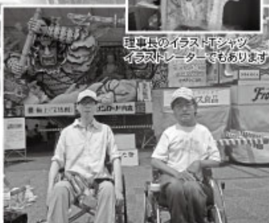
最近、2ショットが多いふたり・・・